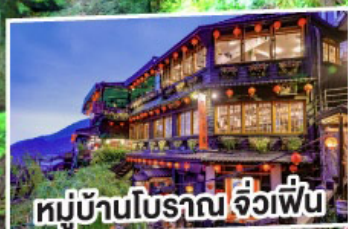
หมู่บ้านโบราณ จ๊วเพื่อน