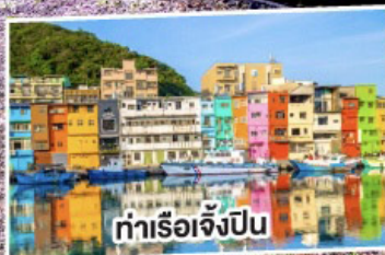
ท่าเรือเจ๋งป็น