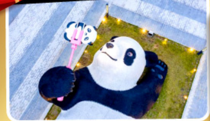
หมีแพนด้าอนเซลฟ์