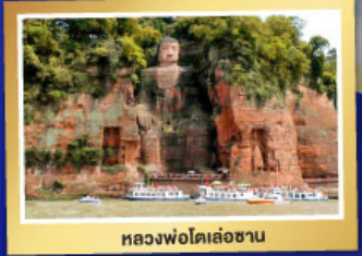
หลงฟอโตเล่ฮาน