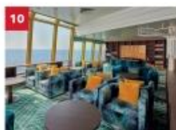
Palm Court Relax in our sophisticated observatory lounge as you enjoy sweeping ocean views.