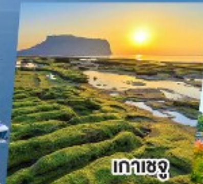
เกาะเชจู