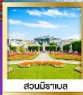
สวนมิราเบล