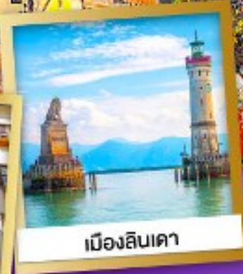
เมืองลินเคา