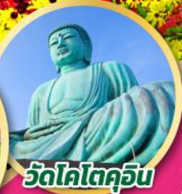
วัดโคโตคุอิน