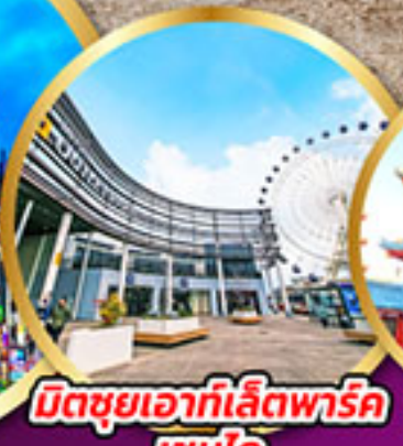
มิตซูบยาอากะไมพาร์ค เซนได