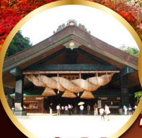
ศาลเจ้าอิชิโมะโทชะ