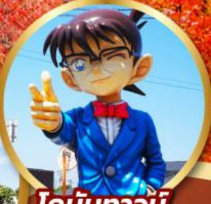
โคนันทาวน์