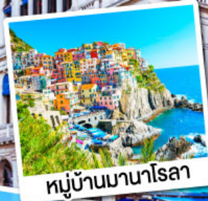
หมู่บ้านมานาโรลา

เที่ยวเก็บครบไฮไลค์โดโลไมท์ ทั้งทะเลสาบมิสุรีน่า