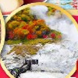
หุบเขานรกจิกุกุคาบิ