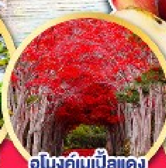
อุโมงค์เมเปิ้ลแดง ณ สวนลันฮิราโอกะ