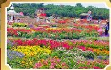
สวนสวรรค์ดอกไม้สีฤดู (Autumn Flower Garden)