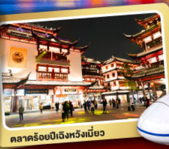
ตลาดร้อยปีเจิ้งหรงเหมียว