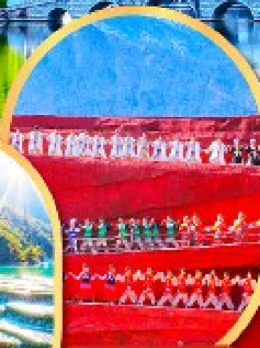
โชว์ Impression Lijiang