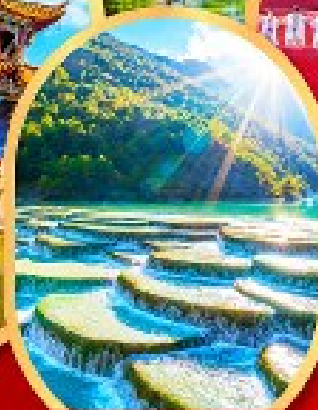
หุบเขาสีน้ำเงิน