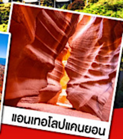
แอนเทอโลปแคนยอน