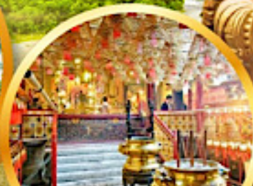
วัดม้านใหม่