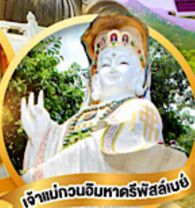
เจ้าแม่กวนอิมหาครีพีส์ลีย์