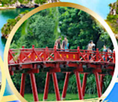
สะพานแสงอาทิตย์