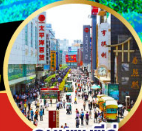
ถนนชุนชี่ลู่

-เมนูพิเศษ สุกี้หมาล่าเสฉวน , เปิดปิกนิก