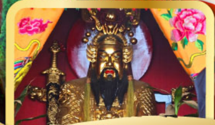
• ศาลเจ้าพ่อเสือ