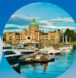
Victoria, British Columbia (Canada)