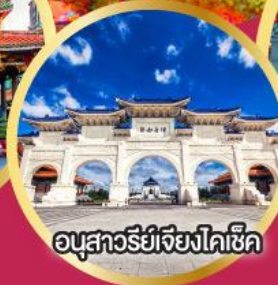
อนุสาวรีย์เจียงไคเช็ค