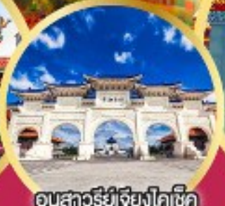
อนุสาวรีย์เจียงไคเช็ค