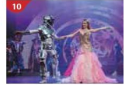
10 Zodiac Theatre Enjoy live production shows from the acclaimed award-winning entertainment team.

**เรือจะมีใบแจ้งสถานที่และเวลาที่ห้องพักของท่านเพื่อนำท่านรับหนังสือเดินทางคืน