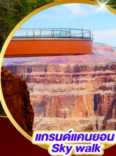
แกรนด์แคนยอน Sky walk