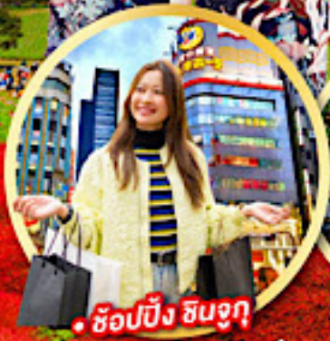
• ช้อปปิ้ง ซินจูกุ

กิจกรรมใส่ชุดกิโมโน พร้อมชมโชว์การแสดงต่างๆ