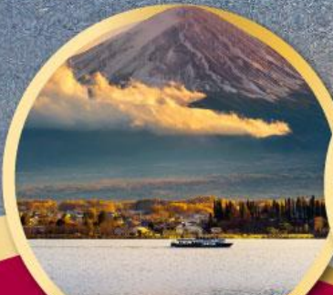
ทะเลสาบคาวากุจิโกะ