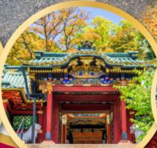
ศาลเจ้าโทโชคุ