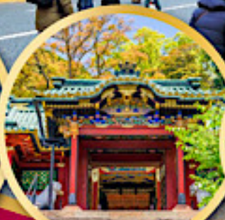
ศาลเจ้าโทโชคุ