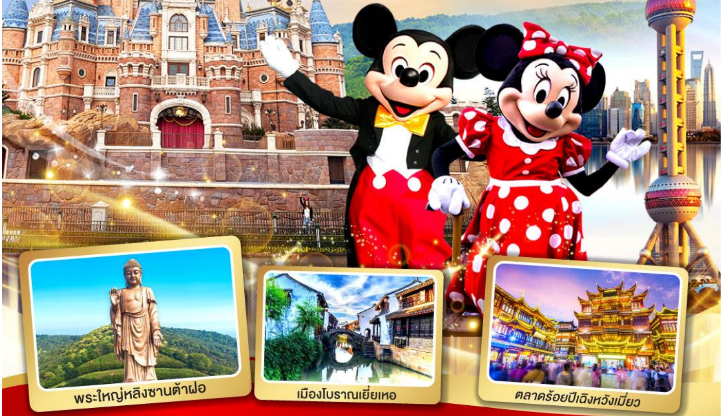
พระใหญ่หลังซานต้าฝอ