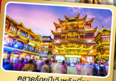
ตลาดร้อยปีเจิ้งหวงเมี่ยว