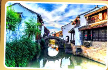
เมืองโบราณเยี่ยเหอ