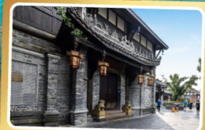
ถนนควานโจเซียงจื่อ