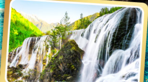
น้ำตกธารโง่บูก

ชมโชว์เปลี่ยนหน้ากาก เมนูพิเศษ สุกัหม่าล่าเสฉวน