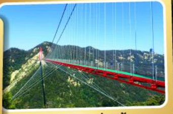
สะพานแวนอ้ายจ้าย