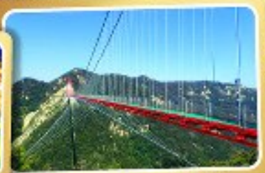
สะพานแขวนอ้ายจ้าย