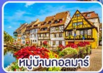
หมู่บ้านกอลมาร์