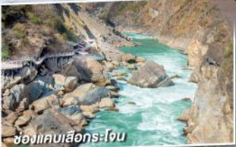
ช่องแคบเสือกระโจน