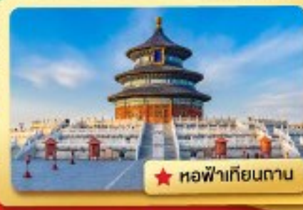
★ หอฟ้าเทียนถาน