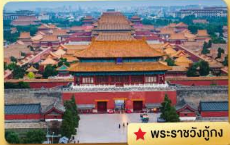
★ พระราชวังกู้กง