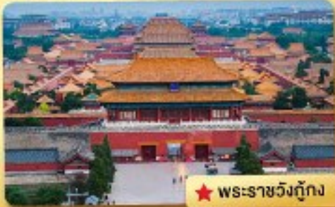
★ พระราชวังกู้กง