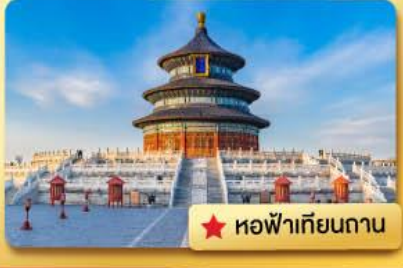
★ หอฟ้าเทียนถาน