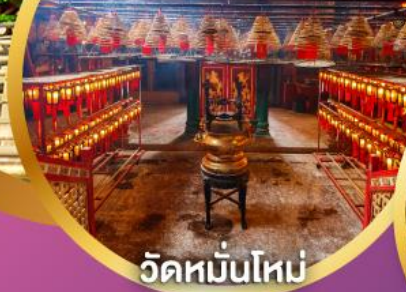
วัดหมื่นโหม่