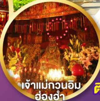
เจ้าแม่กวนอิม ฮ่องกง