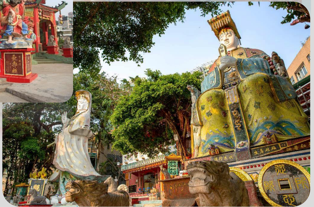
GO1HKG-EK035 Hong Kong ช่องกง สายมูทันใจ ไหว้พระ 9 วัด 3 วัน 2 คืน โดยสายการบิน Emirates (EK)