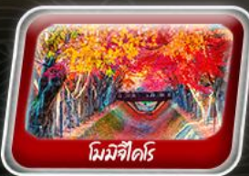
โทมิจิไดริ

สายการบิน AirAsia X (XJ) น้ำหนักกระเป๋า 20 KG