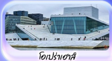
โอเปร่าเฮาส์

07-15 ต.ค.69 / 16-24 ต.ค.69 13-21 พ.ย. 69 / 04-12 ธ.ค. 69 25 ธ.ค. 69 - 02 ม.ค. 70 (ปีใหม่)