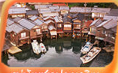
หมู่บ้านชาวประมงอิเะ