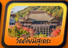
วัดคิโยมิสุตระ

พักฟูจิออนเซ็น 1 คืน กิฟุ 1 คืน โทยาม่า 1 คืน นาริตะ 1 คืน