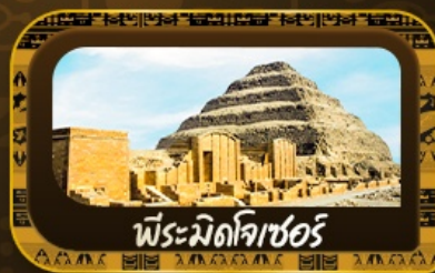
พีระมิดกิซอร์