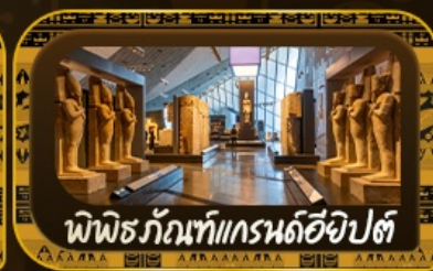
พีพีธกรัทท์แกรนด์อียิปต์