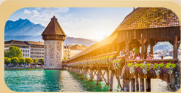
สะพานไม้ม้าเปลา

25 มี.ค. - 01 เม.ย. 69 / 04-11 เม.ย. 69 08-15 เม.ย. 69 / 28 เม.ย. - 05 พ.ค. 69 27 พ.ค. - 03 มิ.ย. 69