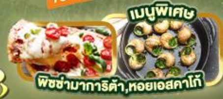
เมนูพิเศษ พิซซ่ามาการิต้า, หอยเอสคาโก้