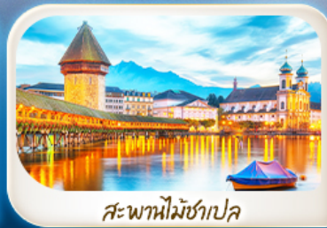
สะพานไมซ์ฮาเปิล