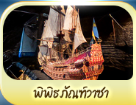
พิพิธภัณฑ์ทิวาซา