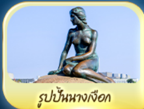
รูปปั้นนางเงือก