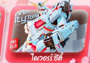
ไดเวอร์ซิตี