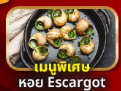
เมนูพิเศษ หอย Escargot