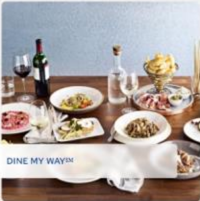
DINE MY WAY SM