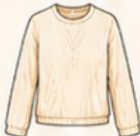
เสื้อแขนยาว