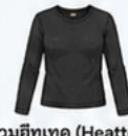
สวมฮีตเทค (Heatech) แบบหนาพิเศษด้านใน