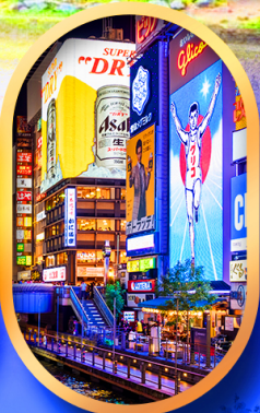
ย่านชินไซบาชิ