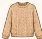
เสื้อไหมพรม