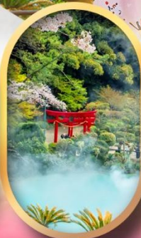
อุมิจิโกกุ