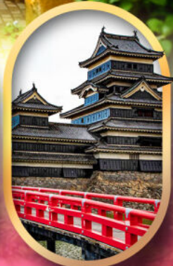
ปราสาทคามาโมโตะ