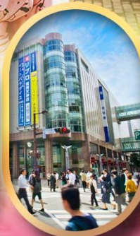
ช้อปปิ้งย่านเท็นจิน