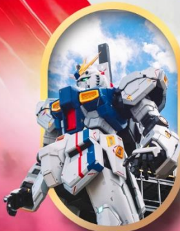
ห้างลาลาพอกันดั้ม