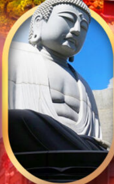
พระใหญ่อะตะมะ