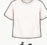
เสื้อยืด