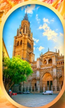
มหาวิหารโตเลโด