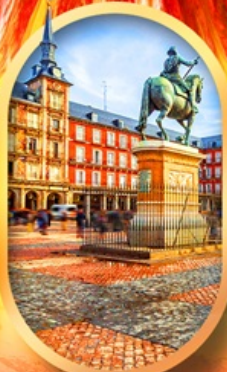
พลาซามายอร์