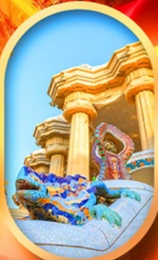
ปาร์ค กูเอล