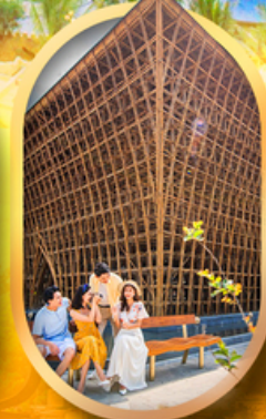
อาคารไม้ไผ่