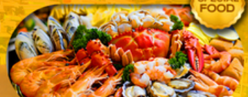
พิเศษเมนู ซิวัดบุฟเฟ่ต์ 1 มื้อ เดินทาง มีนาคม 2569