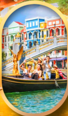
เรือสำเภาเวียดนาม