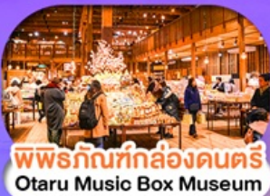
พิพิธภัณฑ์กล่องดนตรี Otaru Music Box Museum