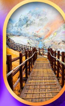
หุบเขานรกจิงคุดานิ